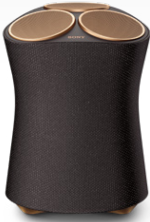
360 Reality Audio 対応 ワイヤレススピーカー SRS-RA5000 オープン価格