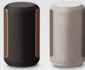
ブラック(B) / ライトグレー(H)