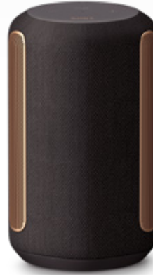
360 Reality Audio 対応 ワイヤレススピーカー SRS-RA3000 オープン価格